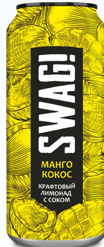
Манго & кокос