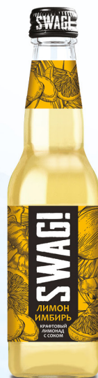
Лимон & имбирь