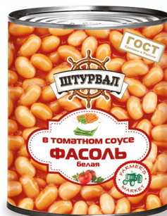
Фасоль белая в т/с