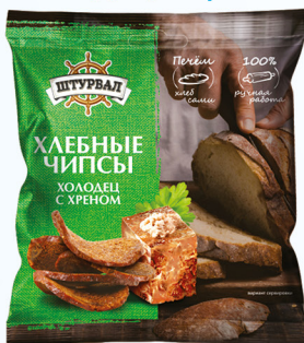
Холодец с хреном