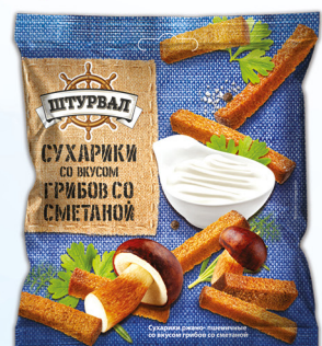
Грибы со сметаной