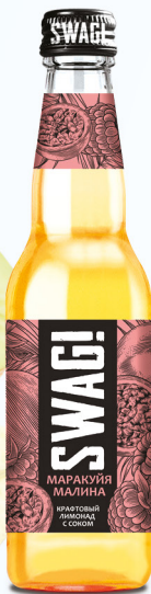
Маракуйя & малина