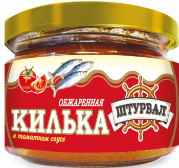
Килька обжаренная в т/с, СТ/Б