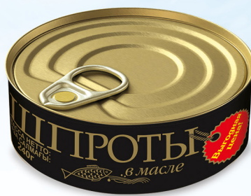
Шпроты в масле «Выгодная цена»