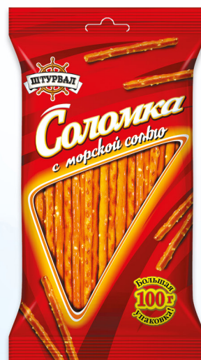
Соломка с морской солью