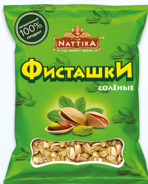
Фисташки соленые «NATTIKA»