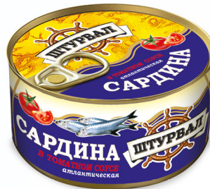
Сардина в т/с