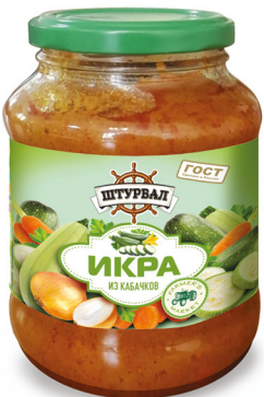
Икра из кабачков