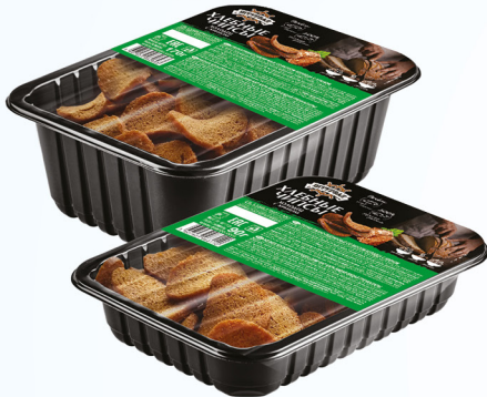
Холодец с хреном