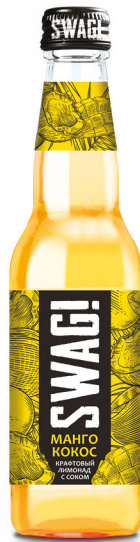
Манго & кокос