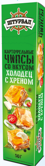
Холодец с хреном