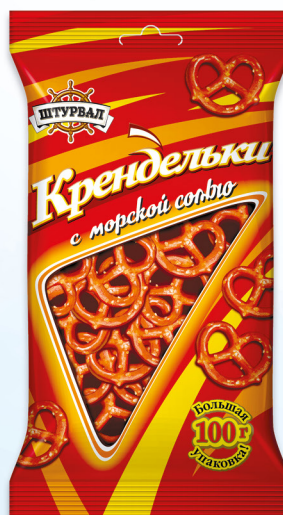
Крендельки с морской солью