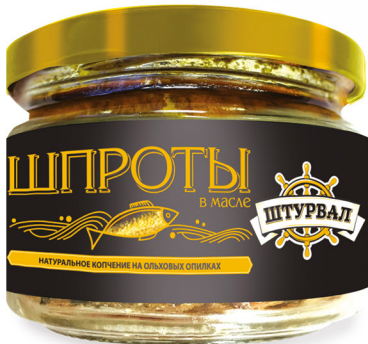
Шпроты в масле ГОСТ, СТ/Б