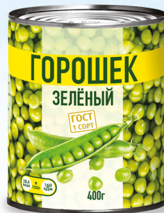
Зелёный горошек 1 сорт