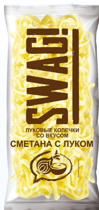
Сметана с луком