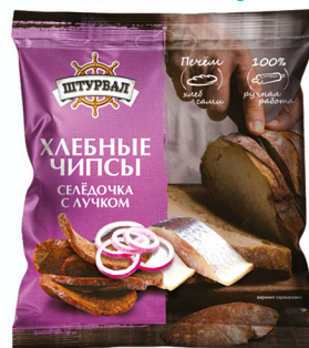
Селедочка с лучком