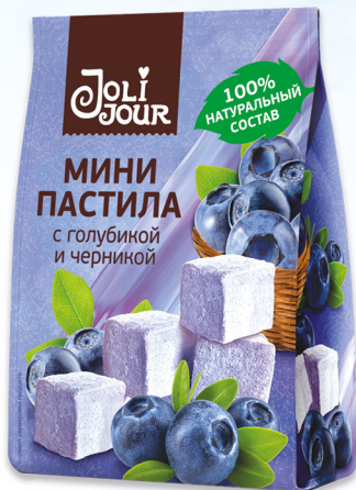
МИНИ ПАСТИЛА с голубикой и черникой