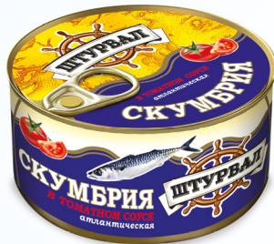
Скумбрия в т/с