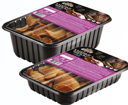
Селедочка с лучком