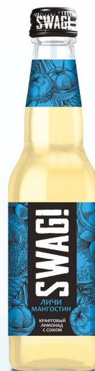
Личи & мангостин