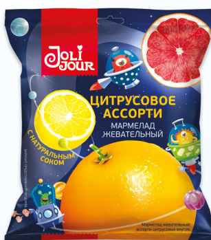
МАРМЕЛАД ЖЕВАТЕЛЬНЫЙ цитрусовое ассорти