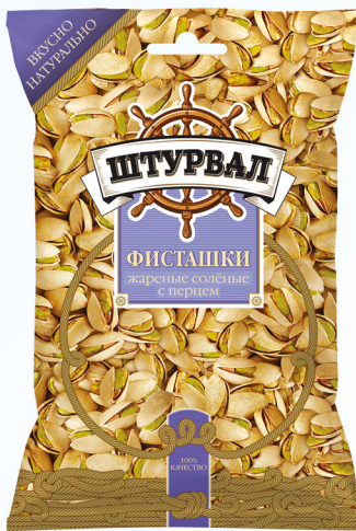
Фисташки с перцем