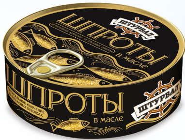
Шпроты в масле ГОСТ