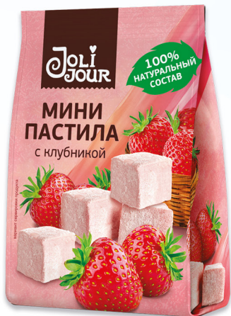
МИНИ ПАСТИЛА с клубникой

Современные, легкие и натуральные десерты с оригинальными и необычными вкусами на основе фруктов, ягод и семян.