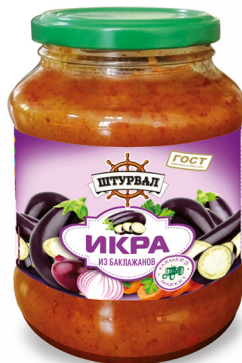
Икра из баклажанов