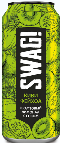
Киви & фейхоа