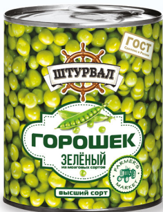
Зелёный горошек в/с

Зелёный горошек в/с и кукуруза сахарная в/с произведены в соответствии с ГОСТ из свежего отборного сырья прямо с поля. Без использования замороженного и сублимированного сырья. Только натуральные ингредиенты в составе, без использования ГМО, ароматизаторов, красителей и усилителей вкуса.