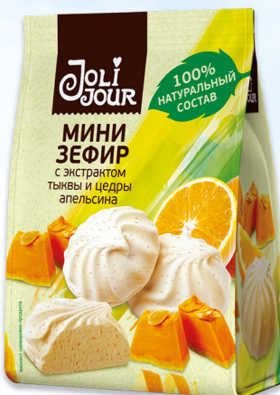
МИНИ-ЗЕФИР с экстрактом тыквы и цедры апельсина