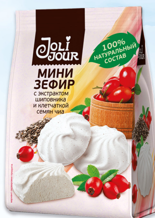
МИНИ-ЗЕФИР с экстрактом шиповника и клетчаткой семян чиа