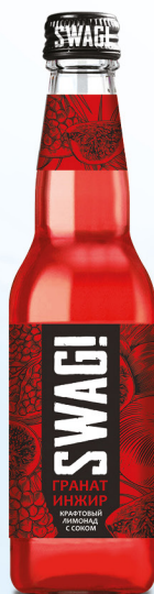
Гранат & инжир