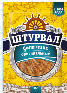
Фиш чипс оригинальные