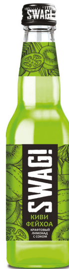
Киви & фейхоа