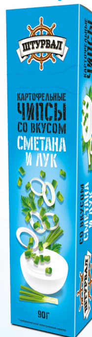
Сметана и лук