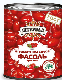
Фасоль красная в т/с