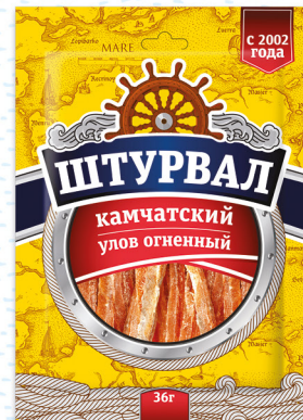
Камчатский улов огненный