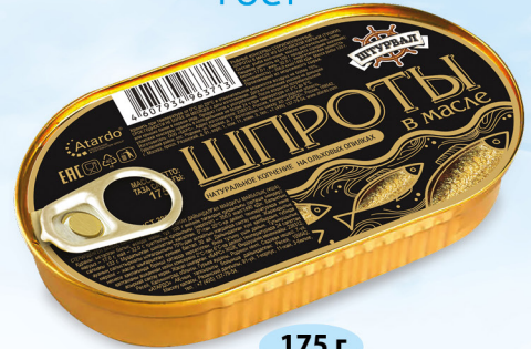
Шпроты в масле ГОСТ