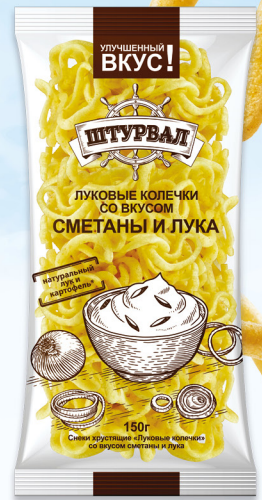
Сметана и лук