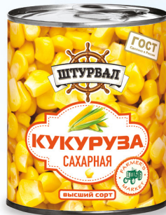
Кукуруза сахарная в/с