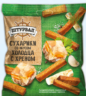
Холодец с хреном