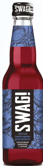
Черная с мородина & драгонфрут