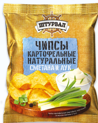
Сметана и лук